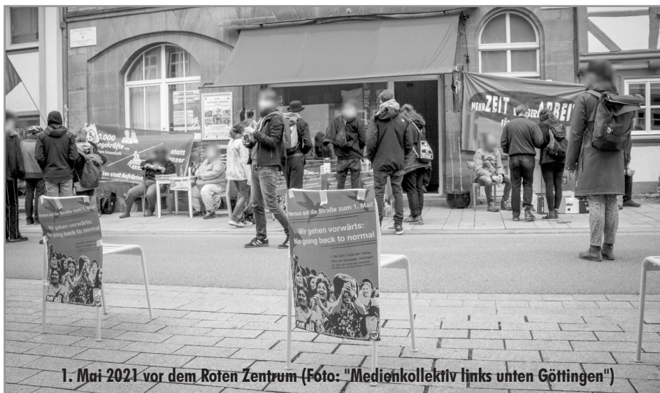
1. Mai 2021 vor dem Roten Zentrum