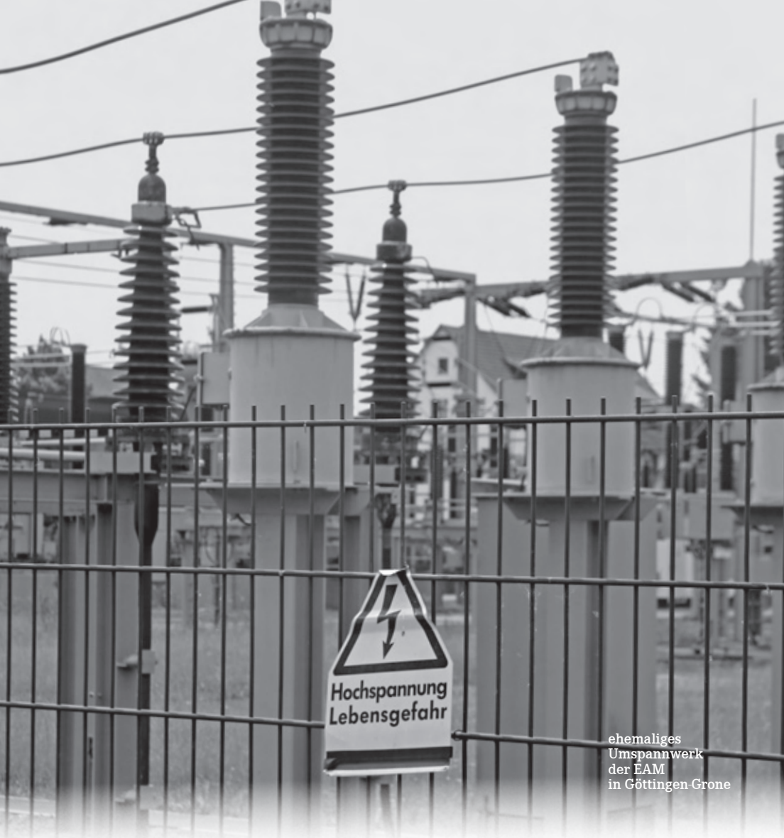
ehemaliges Umspannwerk der EAM in Göttingen-Grone