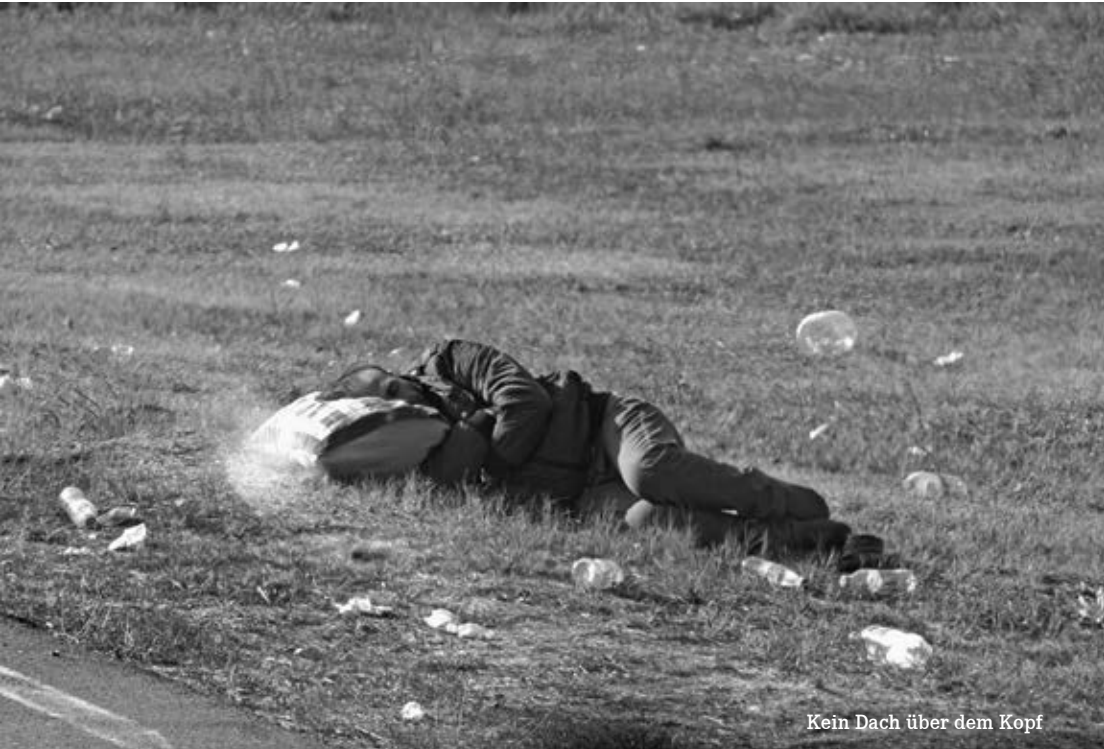
Kein Dach über dem Kopf

Die Auslagerung von Arbeitsstellen an private Arbeitgeber, um Menschen im Niedriglohnbereich zu beschäftigen, bekämpfen wir.