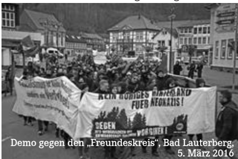
Demo gegen den „Freundeskreis“, Bad Lauterberg, 5. März 2016

Wiederholt haben rechtspopulistische Parteien in diesem Jahr bei Kommunal- und Landtagswahlen sogar 2-stellige Prozentzahlen erreicht. Natürlich erfüllt uns dies mit großer Sorge. Durch Rassismus und Ausgrenzung werden die