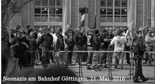
Neonazis am Bahnhof Göttingen, 21. Mai 2016

Interessen der Mehrheit nicht gestärkt. Ganz im Gegenteil: Menschen, die als Geflüchtete aus anderen Ländern hierher kommen, werden, indem sie entrechtet und drangsaliert werden, in Niedriglohnverhältnisse gedrängt. Sie können erst dadurch besonders für Lohndumping instrumentalisiert werden, von dem dann alle betroffen sind. Daher halten wir die „Lösungen“, die Parteien wie z. B. die AfD anbieten, nicht nur für menschenverachtend, sondern glauben, dass sie für alle Bürger*innen von Nachteil sind.