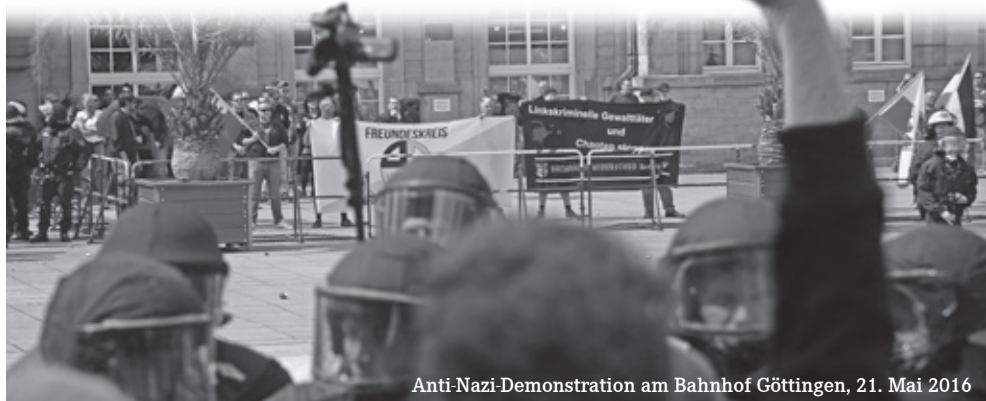
Anti-Nazi-Demonstration am Bahnhof Göttingen, 21. Mai 2016