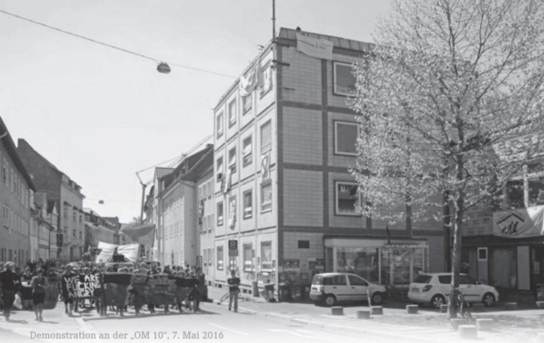
Demonstration an der „OM 10“, 7. Mai 2016

keine Abschiebungen langjährig hier lebender bzw. hier geborener Menschen geben. Wir unterstützen ausdrücklich die verschiedensten Formen zivilgesellschaftlicher Hilfen und Aktivitäten. Dazu gehören auch selbstverwaltete In-