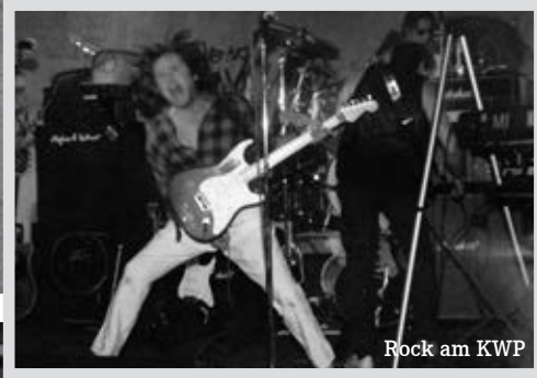
Rock am KWP