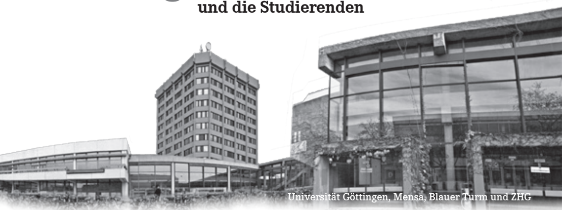
Universität Göttingen. Mensa, Blauer Turm und ZHG

Die Universität und die vielen Studierenden prägen unsere Stadt und den Landkreis in besonderer Weise. Die Situation auf dem Wohnungsmarkt muss nicht nur für Studierende verbessert werden. Wir brauchen keine Kriegsforschung.