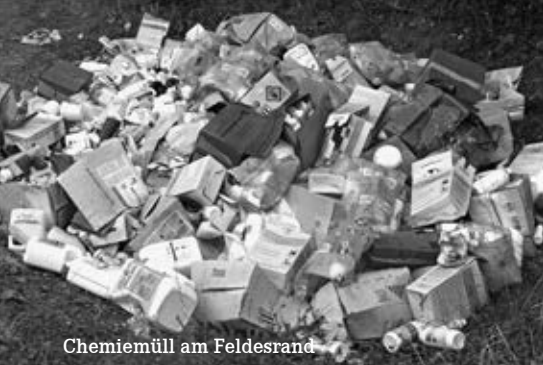
Chemiemüll am Feldesrand

Die Flora-Fauna-Habitat-Richtlinie der EU von 1992 (FFH) gibt Regeln für den Naturschutz vor. Der Landkreis Göttingen als untere Naturschutzbehörde ist bei der Umsetzung der Mindestanforderungen dieser Richtlinie im Verzug, genau wie viele andere Landkreise in Niedersachsen. Nach Ansicht der Wähler*innengemeinschaft Göttinger Linke und der Partei DIE LINKE wird zu viel Rücksicht auf die Naturnutzer (Waldbesitzer, Forstwirtschaft, Landwirtschaft und Jägerschaft) genommen, wenn es darum geht, den Naturschutz zu verbessern. Darum konnte zum Beispiel das FFH-Gebiet Schwülme und Auschnippe in Adelebsen nicht als Naturschutzgebiet ausgewiesen werden.