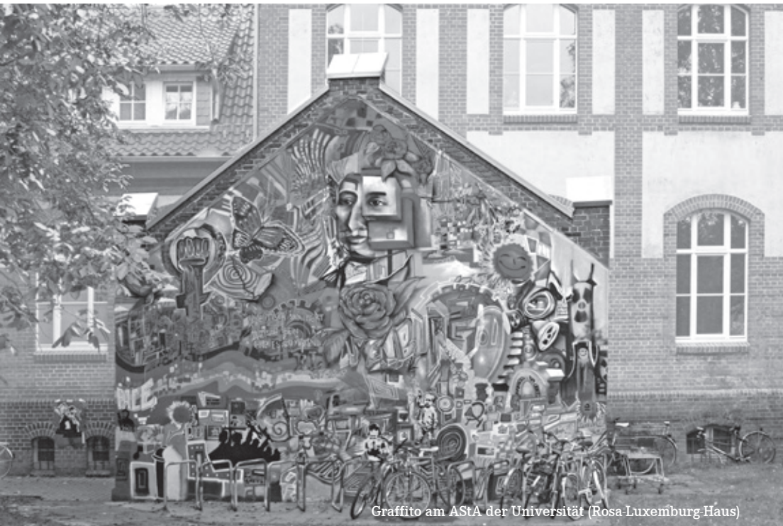
Graffiti am ASTA der Universität (Rosa-Luxemburg-Haus)