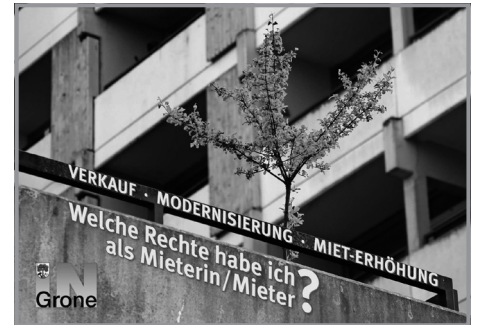
Mietbroschüre des Vereins „IN Grone“, Kosten: 2 Euro (incl. Porto)

Die Grobiane bei ihrer Auswertung: Das war schon ein tolles Fest, bei dem es vielfältige Eindrücke und Informationen gab. Leider