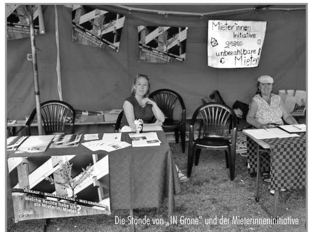
Die Stände von „IN Grone“ und der MieterInneninitiative

war es doch sehr auseinandergezogen, so dass der Platz vor der Bühne oftmals ein wenig leer wirkte. Außerdem fand das Fest im Ramadan-Monat statt, so dass ein gewichtiger Anteil der BewohnerInnen des Stadtteils gar nicht kommen konnten. Auch ein evangelischer Gottesdienst in einem Stadtteil mit einem hohen Teil andersgläubiger NachbarInnen war nicht der Punkt auf dem „i“ – auch wenn es das 40. Jubiläum der Jona-Gemeinde war. (gusi)